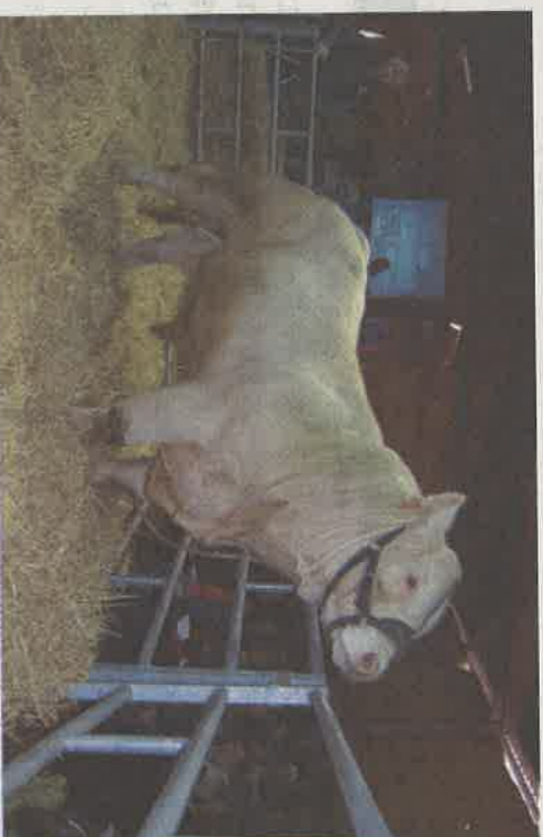
La station de Jalogny offre une large diversité de reproducteurs pour que chaque éleveur puisse trouver celui dont il a besoin.

Les femelles, futures reproductrices bénéficieront de ce travail de cumul génétique. En pratique, l'éleveur procède aux accouplements de son choix. Il peut également choisir d'être conseillé par son technicien Bovins croissance ou son technicien inséminateur.