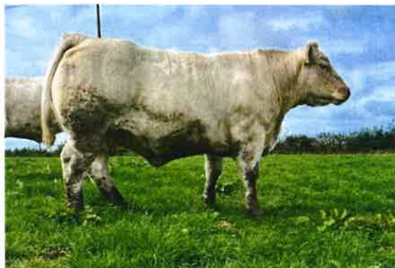
Desbrosses J Malaisie (3).