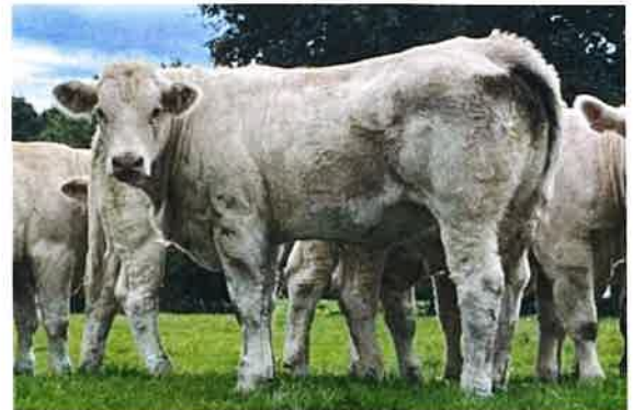
Thomassin R Versailles (3).