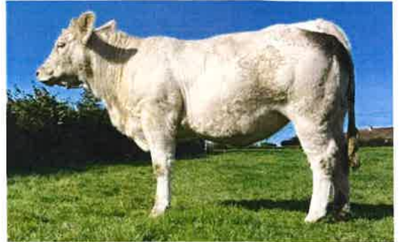
Preaud T Voicc (3).

Certains lots d'embryons n'étant pas encore faits, nous ne pouvons vous présenter la totalité des lots qui seront mis en vente. Mais voici déjà un aperçu des premiers lots d'embryons déjà réalisés : - 3 Voicc / ULMO P appartenant à Thierry Preaud ; - 2 Malaisie / Ordon + 2 Malaisie / Tresor PP SE appartenant au Gaec de Nolat ; - 3 L11 / Spike PP appartenant à l'EARL Dominique Compot ; - 2 Versailles / Torigne PP appartenant à la SCEA Thomassin ; - 3 Unesangirl / Ouistiti CE71 appartenant à Stéphane Berthommier.