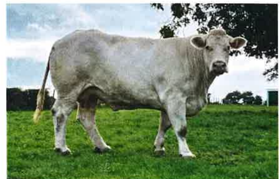
Compot D L11 (10).